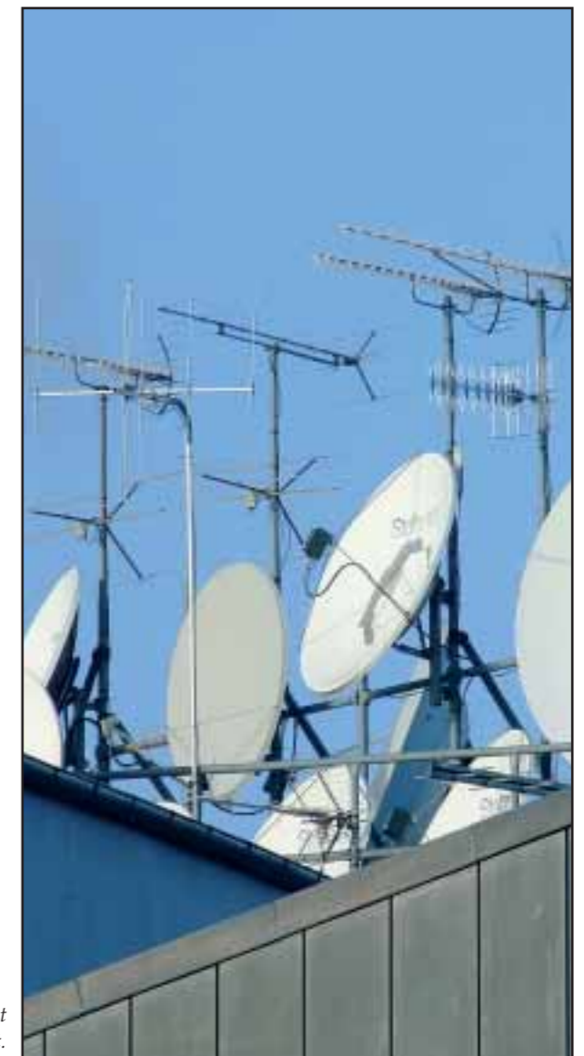
Antenneforeningens hovedstation hos Stofa i Frichsparken er let at kende med de mange antenner og paraboler på taget.