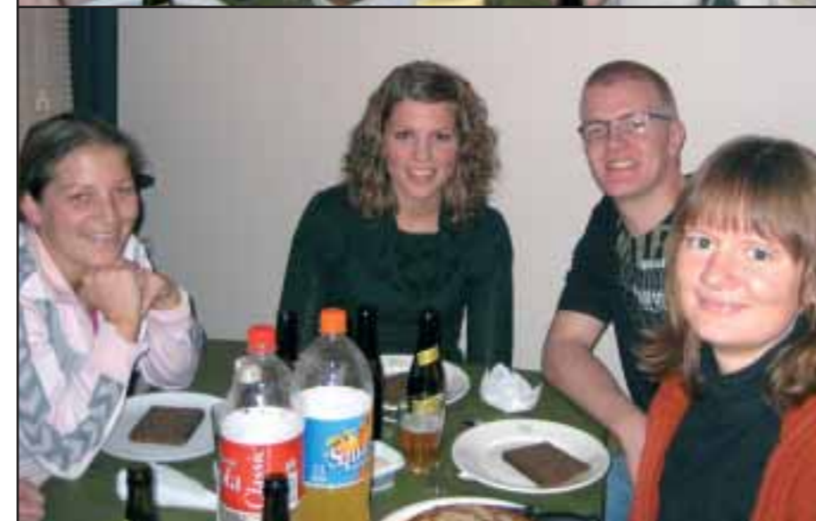
Julefrokost i Bronzealdervænget efter ekstraordinært beboermøde