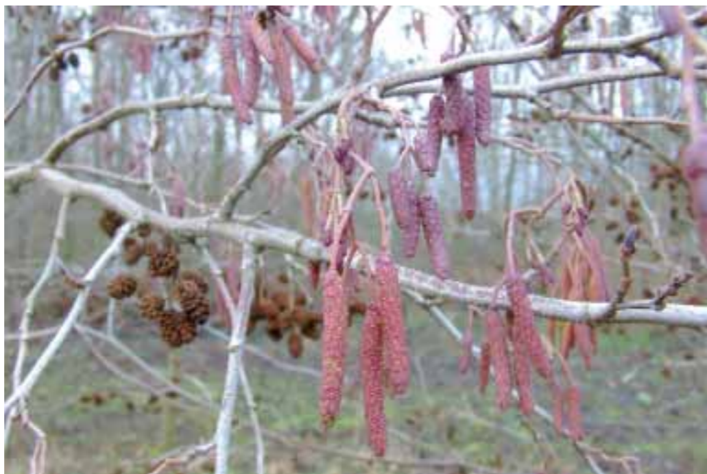
Rød-el i den milde vinter på Holmstrup Mark