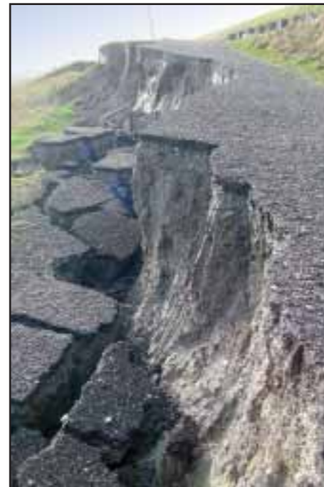
Halvdelen af stien forsvandt i regn på Bjergkammen

I den kolde halvdel af året falder der altid mere nedbør, end der fordampes. Men i løbet af de seneste måneder er der ifølge DMI faldet cirka 30% mere end normalt. Stierne bliver mudrede, så det er bedst at færdes med gummistøvler. Vandstanden i søer og damme stiger, med mindre de er en del af et nøje reguleret vandsystem som f.eks. ses vest for Bremerholm, hvor den nyanlagte langsø for tiden ikke behøver at holde særlig meget vand. Gå dog ikke ned til vandkanten, for mudderet kan være dybt. Jeg har selv afprøvet det, og kan fortælle, at det fine dynd-mudder har en god sugsevne til at holde fast i selv 50cm støvleskaft.