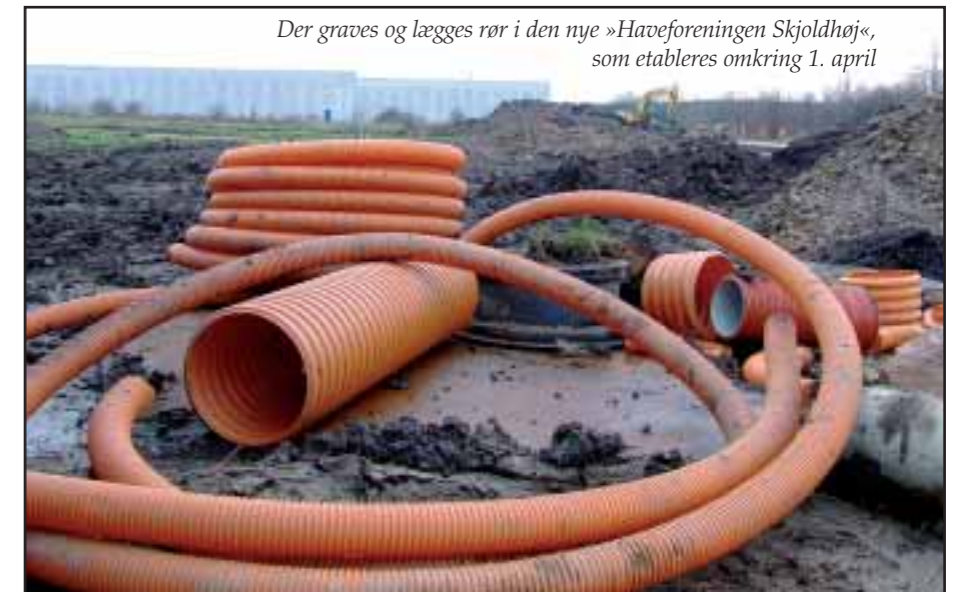
Der graves og lægges rør i den nye »Haveforeningen Skjoldhøj«, som etableres omkring 1. april

kolonihaveejer, som så til gengæld kan regne med (og kræve) noget mere. Bl.a. kan der mulighed for at bygge