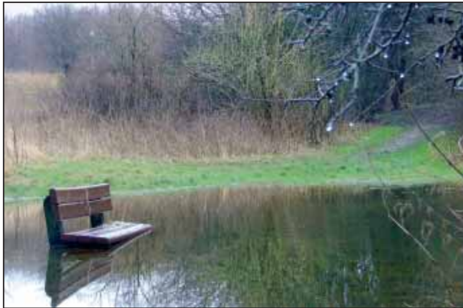
Værsgo og nyd udsigten over mod Grimhøj Gård. Du behøver ikke at sidde på bænken

Vinteren har været endnu mildere end sidste år med flere varmere rekorder. Den eneste dag med sne var den 1. november, og der har kun været ganske få tilfælde af frost. Både mennesker og natur har nydt godt af den forholdsvis lune årstid, hvor der stadig er frodigt og grønt i naturen på Holmstrup Mark. Området ligger kun få skridt fra Holmstrup, Thorsbjerg, Odinsgård, Bronzealdervænget, Toveshøj, og er et område, som vi vil følge i en række artikler.