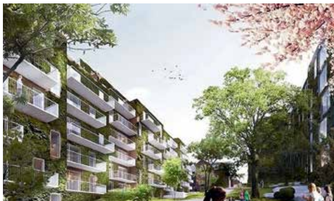
Her ses det bevaringsværdige kasernehospital i baggrunden og det nye, private boligprojekt Valdemars Have i forgrunden. Illustration: schmidt hammer lassen architects.