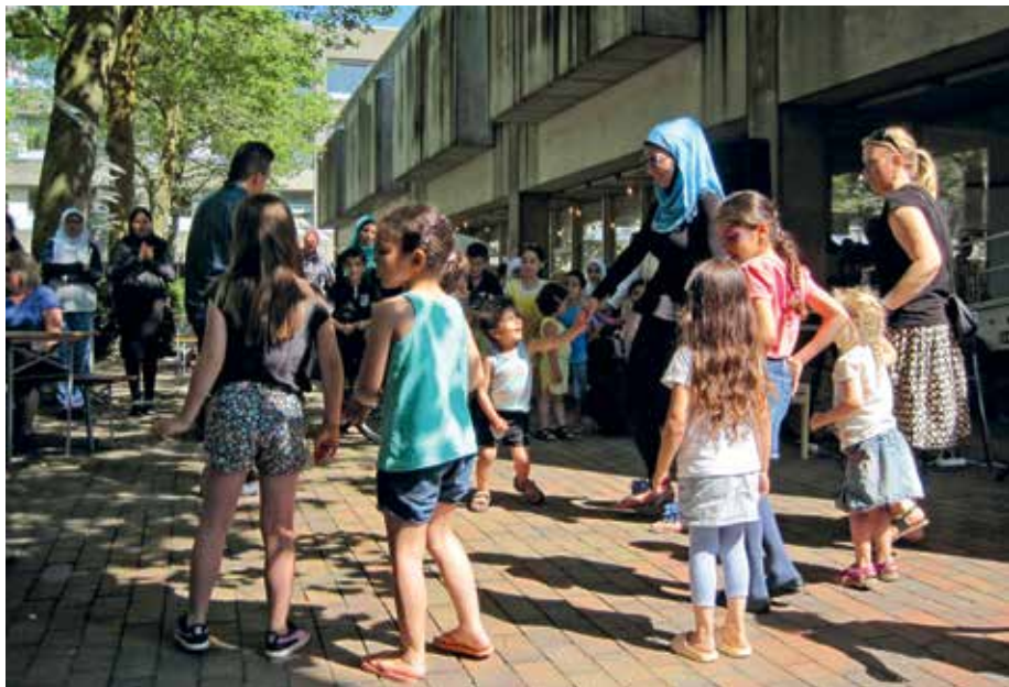
Både voksne og børn dansede stop-dans.

grønne lips grønne lips grønne lips grønne lips grønne lips grønne lips