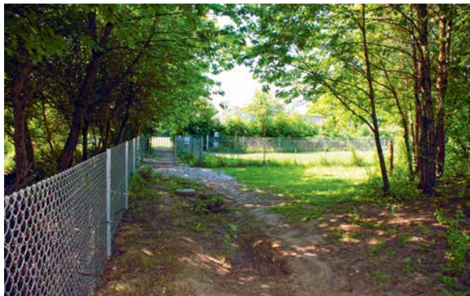
Området er både fladt og kuperet - det elsker hundene.