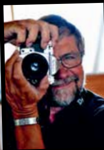
Bo Sigismund, fotograf Foto: Bo Sigismund