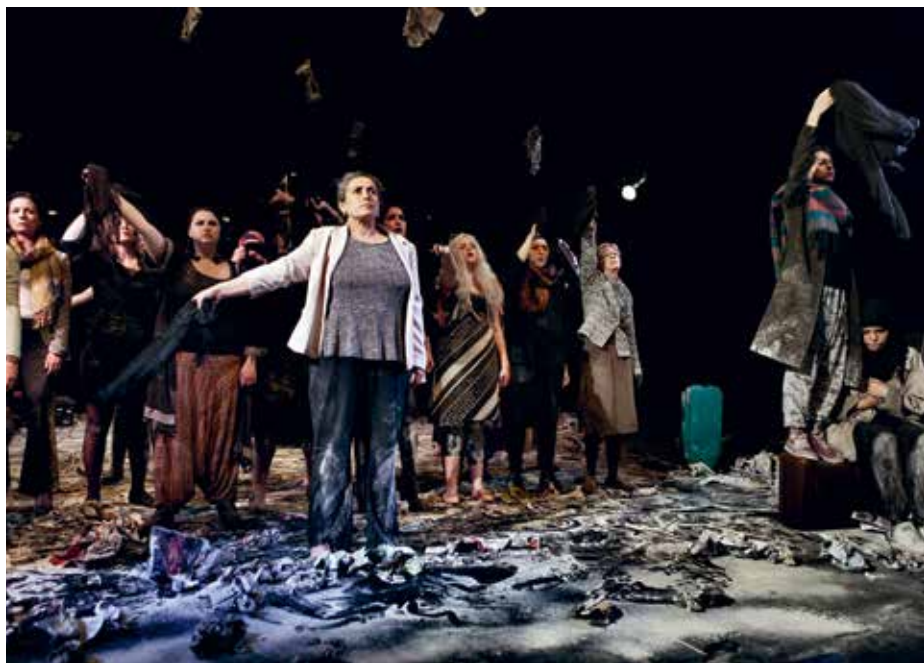
De 20 kvinder var på scenen sammen hele tiden.

Men forestillingen rummer også latter. En latter, der runger i salen, da vi møder den forvirrede og desperate mor, der skal til Uganda - eller var det Tanzania eller måske Angola? - for at hente datteren Ida, der skal giftes med den store, muskuløse..., ja, navnet får vi vist aldrig helt styr på.