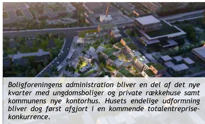
Boligforeningens administration bliver en del af det nye kvarter med ungdomsboliger og private rækkehuse samt kommunens nye kontorhus. Husets endelige udformning bliver dog først afgjort i en kommende totalentreprisekonkurrence.

blevet prækvalificeret til at deltage i konkurrencen, som bliver en totalentreprise. Udbudsmaterialet ligger nu klart og bliver udsendt umiddelbart inden sommerferien. Det er planen, at den nye administrationsbygning kan tages i brug i slutningen af 2018/begyndelsen af 2019.