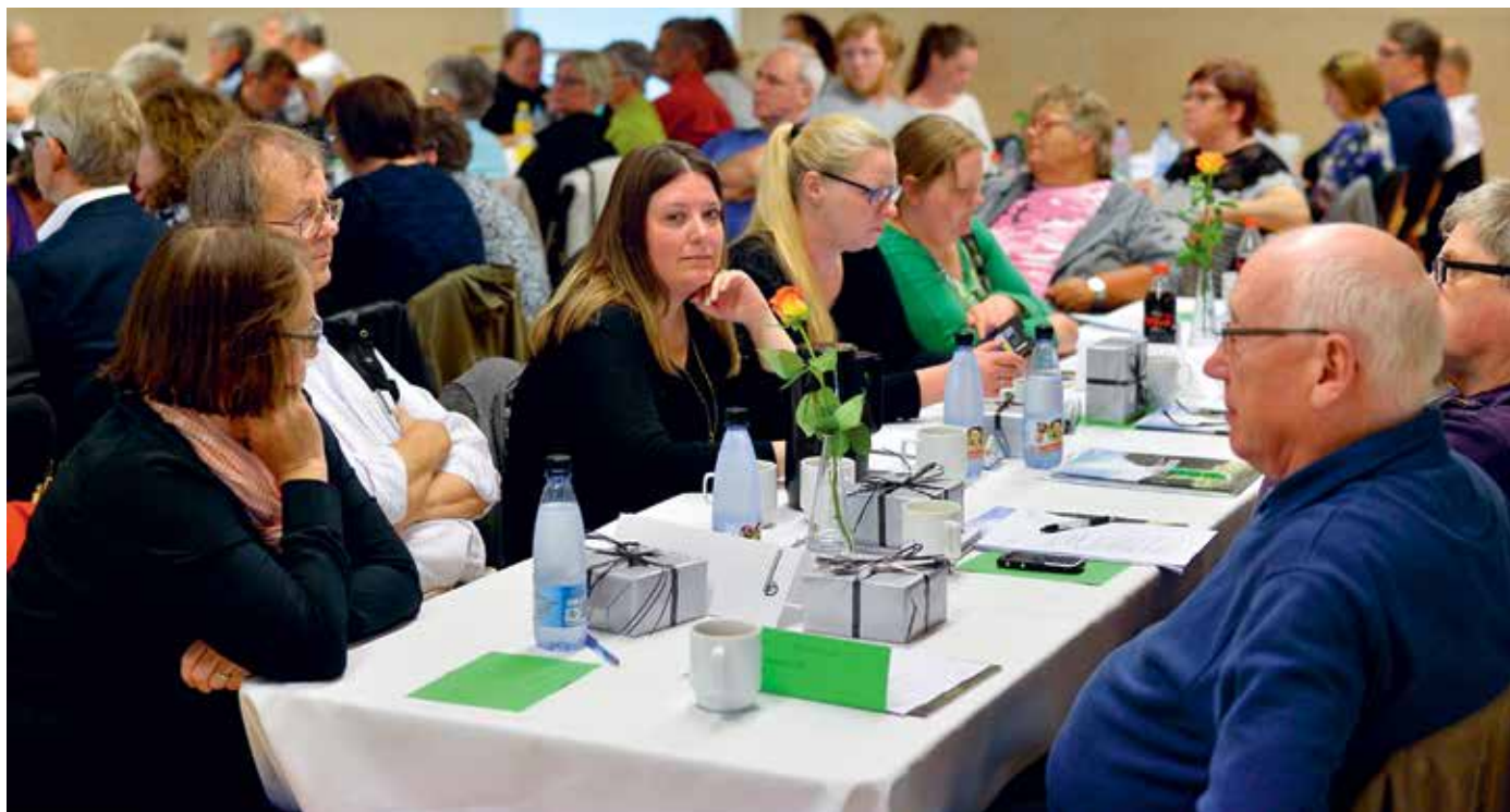
91 medlemmer var til stede, da der blev holdt repræsentantskabsmøde.

En professionel drift kræver organisatoriske ændringer. En effektiv drift og administration er en forudsætning for, at beboerne kan bo godt, og huslejen holdes i ro. Og der arbejdes også