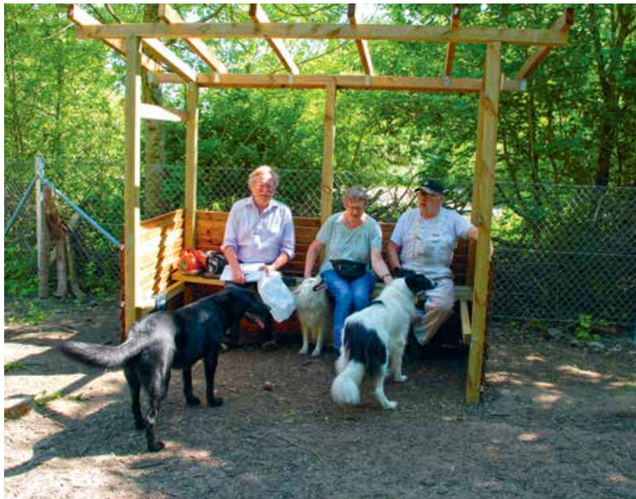
Hundeindhegningen er et godt sted at møde både hunde og mennesker.