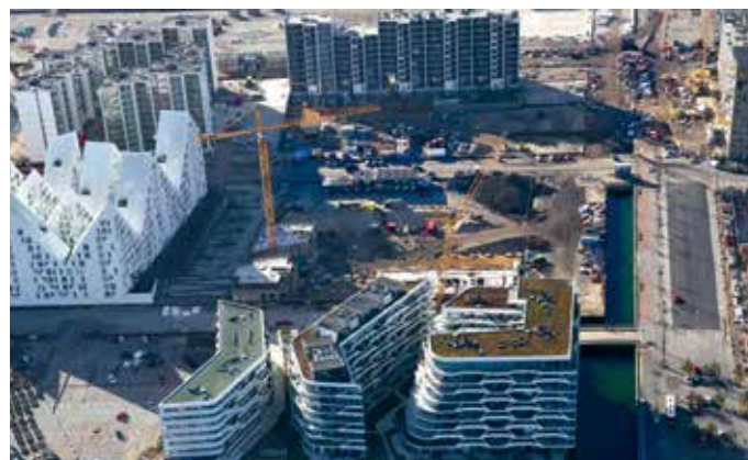
Generationernes Hus skal ligge på Aarhus Ø mellem de to igangværende byggerier Havneholmen og Pakhusene.

Arkitema er blevet valgt til bygherrerådgiver og skal samle trådene i planlægningen af det ambitiøse og innovative byggeri. Lige nu foregår der en dialogproces med de prækvalificerede teams på opgaven. Det er planen, at huset kan tages i brug medio 2019.