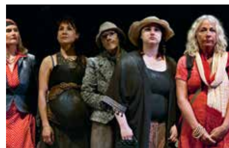
Skuespillerne kommer fra hele Aarhus.

Forestillingen var gennemgående en sanselig oplevelse, hvor stemmer, sang og støv tillod publikum at forsvinde sammen med kvinderne ind i et mellemrum mellem tid og sted.