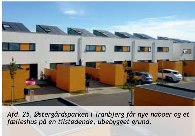
Afd. 25, Østergårdsparken i Tranbjerg får nye naboer og et fælleshus på en tilstødende, ubebygget grund.

fælleshus. Efter sommerferien vil der blive foretaget jordbundsundersøgelser m.v. som baggrund for det konkrete projekt og dets økonomi. Fælleshuset er betinget af godkendelse på afdelingsmøder i både vores egen og AL2 Boligs tilknyttede afdelinger. Hvis der mod forventning ikke skal opføres et fælleshus, er der i stedet kvote til 20 boliger.