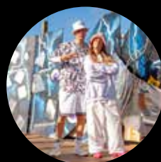
Koncert med HipSomHap madboder og aktiviteter