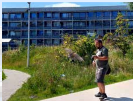
Falken lander snart på armen igen.