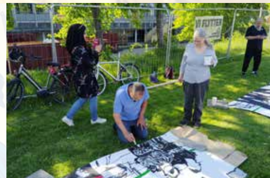
Fire af sagsøgerne var også med til at fremstille protestbanner (se Skråppebladets juli-nummer).

spørgsmålet om den danske lovgivnings legitimitet videre til EU-domstolen i forbindelse med den verserende retssag om Parallelsamfundsloven, som er rejst af beboerne i Mjølnerparken i København. Spørgsmålet er, om loven er lovlig, fordi det er beboernes baggrund, der er den afgørende faktor for at gennemføre nedrivninger og salg. Et EU-direktiv fra 2000 forbyder diskrimination, og dansk lovgivning skal overholde et direktiv. Det er det, som EU-retten skal tage stilling til.