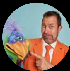
Trylleshow med Jesper Grønkjær