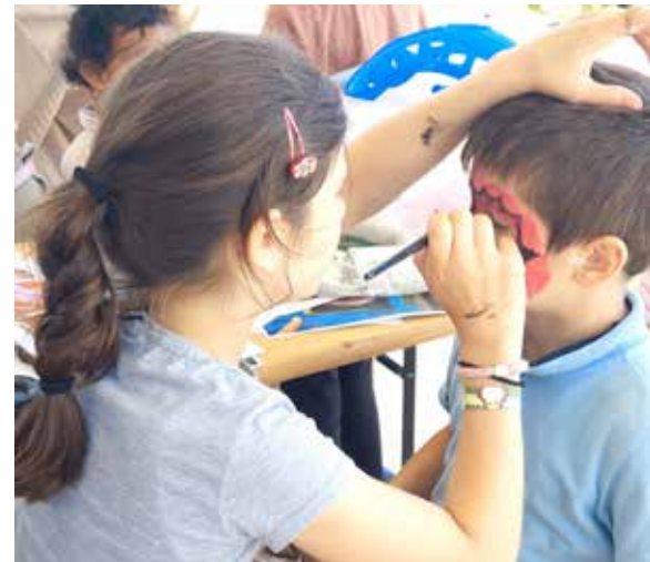
Ansigtsmaling var også ret populært.