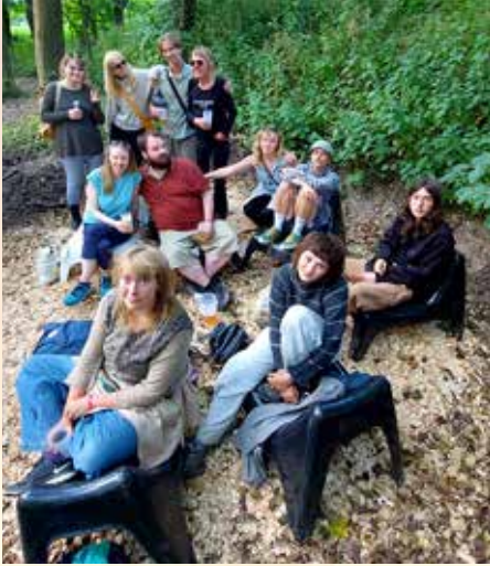
Hele "familien" samlet på Undergrim.