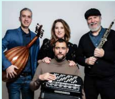
Middle East Peace Ensemble.

Søndag begynder med en international fredsgudstjeneste, efterfulgt af en frokost. Festivalen afsluttes med en koncert med Middle East Peace Ensemble, hvor musikken improviseres ud fra publikums input og dagens stemning. Koncerten rummer et bredt repertoire, fra danske sange til verdensmusik, og inkluderer ofte publikumsdeltagelse i sang og dans.