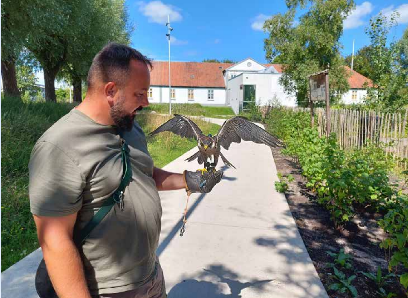
Klar til jagt.