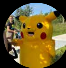
Pikachu og mange andre figurer på ruten