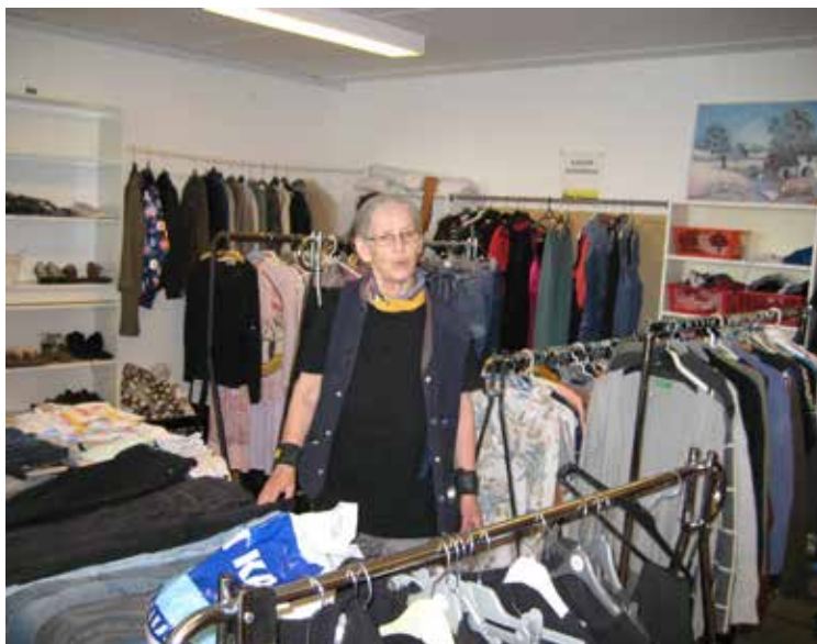
Brita i det store udvalg.

Genbrugsen ligger ved siden af fællesvaskeriet i Holmstrup.