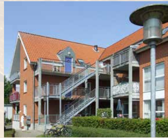
Højriisparken er et af de steder, beboerne slipper for at betale en månedens husleje.

Siden aftalen har der været arbejdet på at udvikle en model til at fordele de afsatte 350 millioner kroner fra Landsbyggefonden